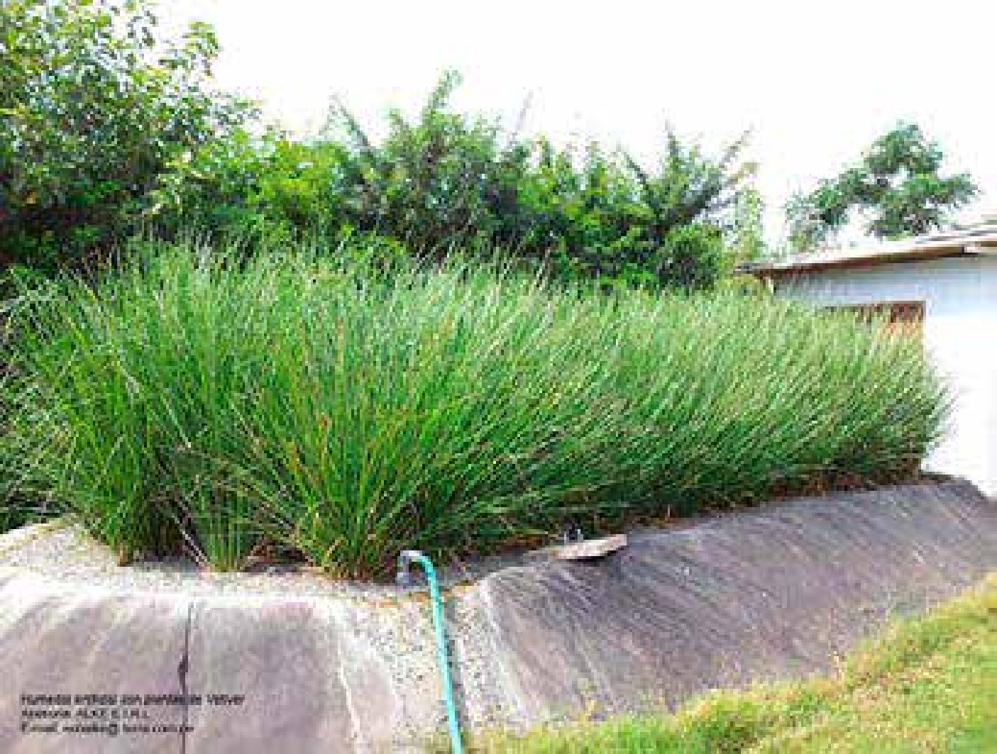
Humedal artificial con plantas de Vetiver Asociación ALCE S. C.A.S. E-mail: alce@alce.com.ec www.alce.com.ec